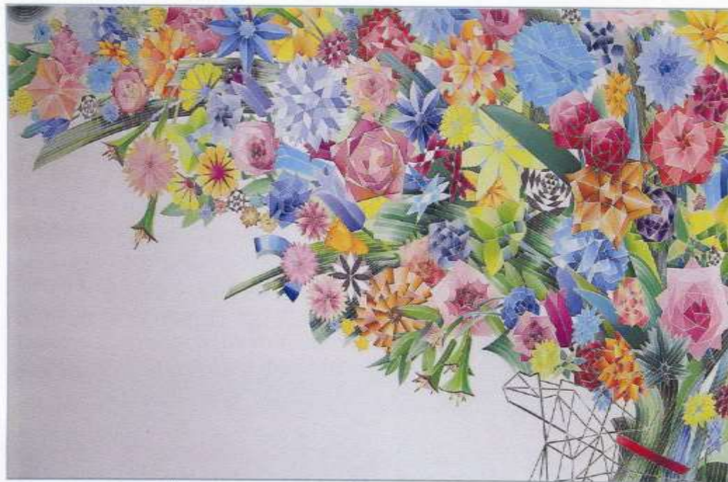
Лариса Наумкина. Хорошие новости. Шелк, роспись, 85×140

Вторая половина и особенно конец XX века характеризуются в России бурным развитием этого вида искусства, открытием новых направлений в технике и появлением ярких имен.