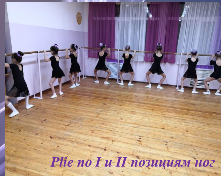
Plie по I и II позициям ног