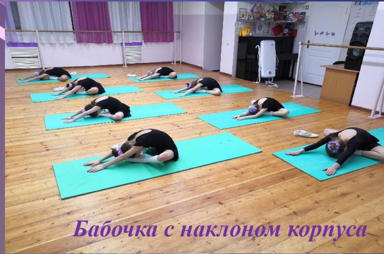
Бабочка с наклоном корпуса