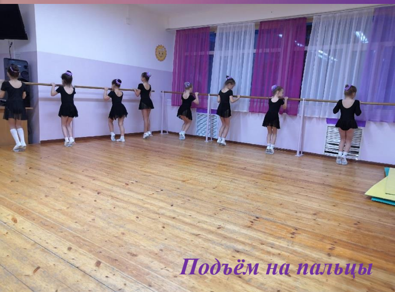
Подъём на пальцы