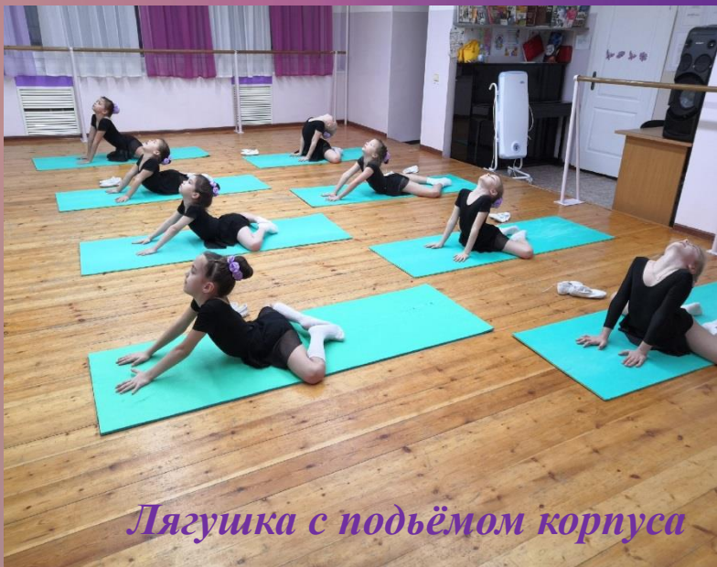
Лягушка с подъёмом корпуса