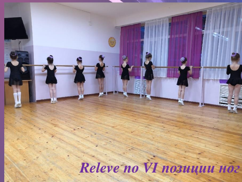
Releve по VI позиции ног