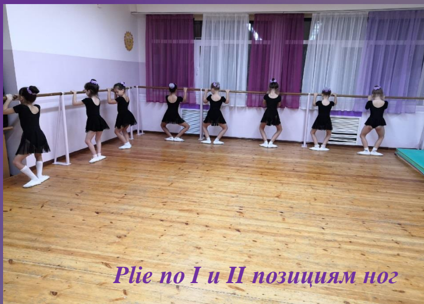
Plie по I и II позициям ног