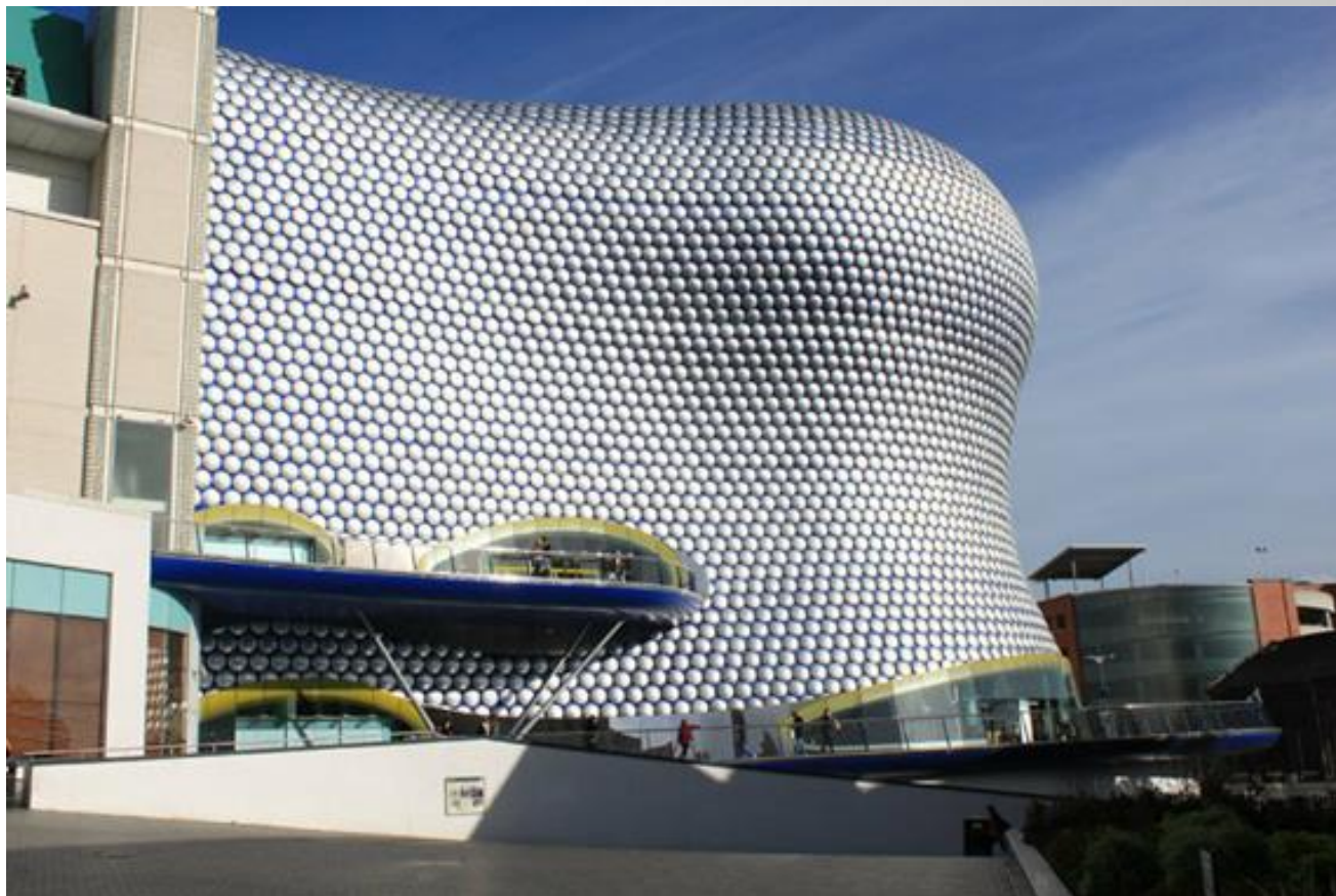
Архитектор Ян Каплицкий