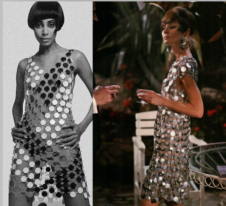
Па́ко Раба́н (фр. Rasó Rabanne )

С платьем Па́ко Раба́н (фр. Rasó Rabanne ) ситуация обратная. Это платье послужило для архитектора Янга Каплицки вдохновением для создания торгового центра в Бирмингеме.