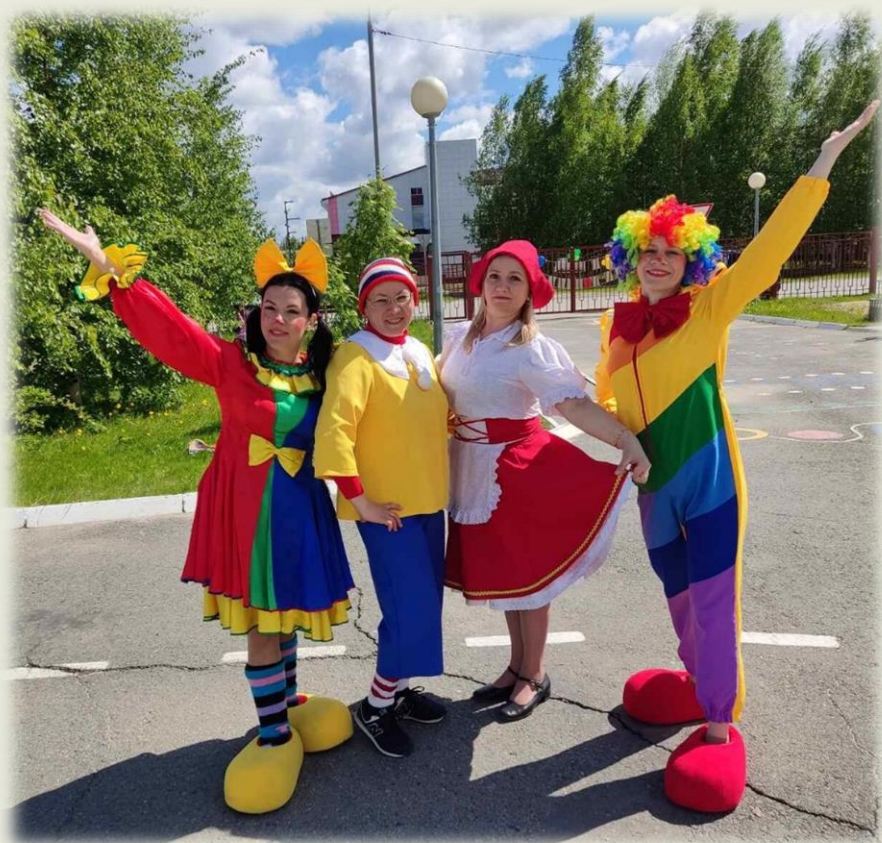
Дни дополнительного образования в школе