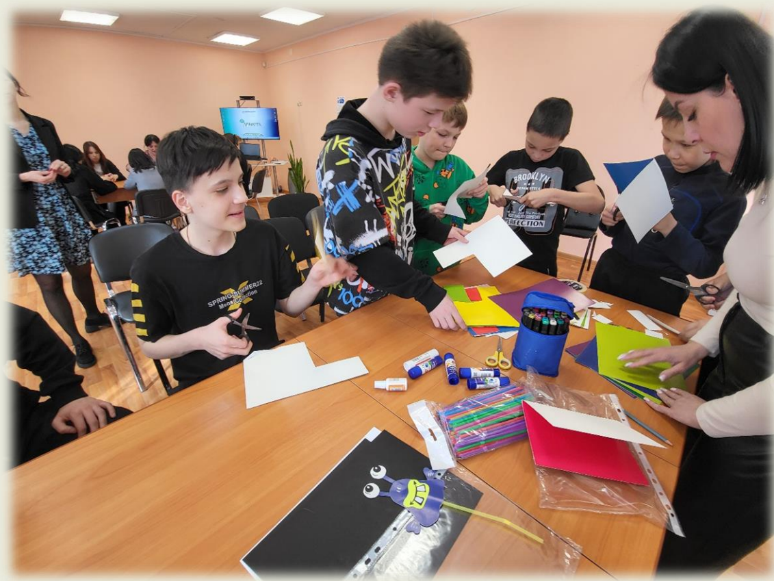
Мастер-класс в КЦСОН «Забота»