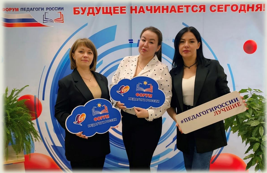
Форум «Педагоги России»