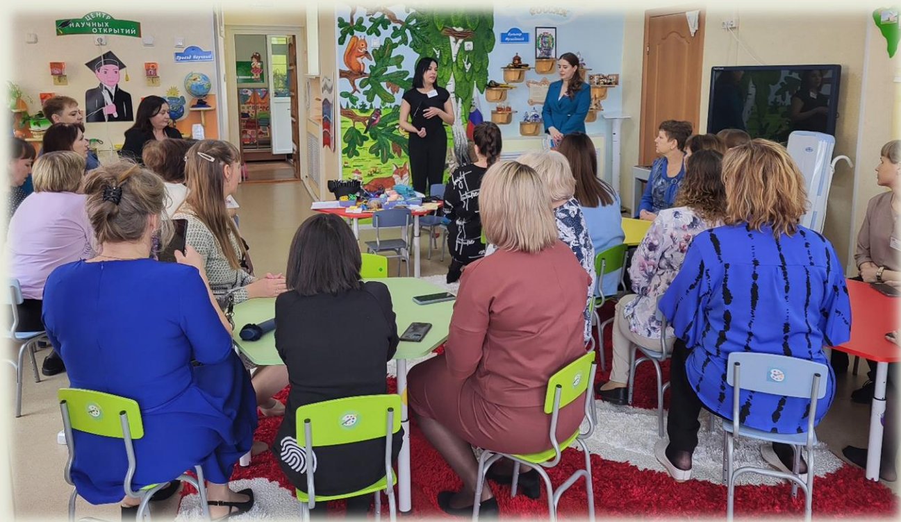
Мастер-класс для педагогов детских садов