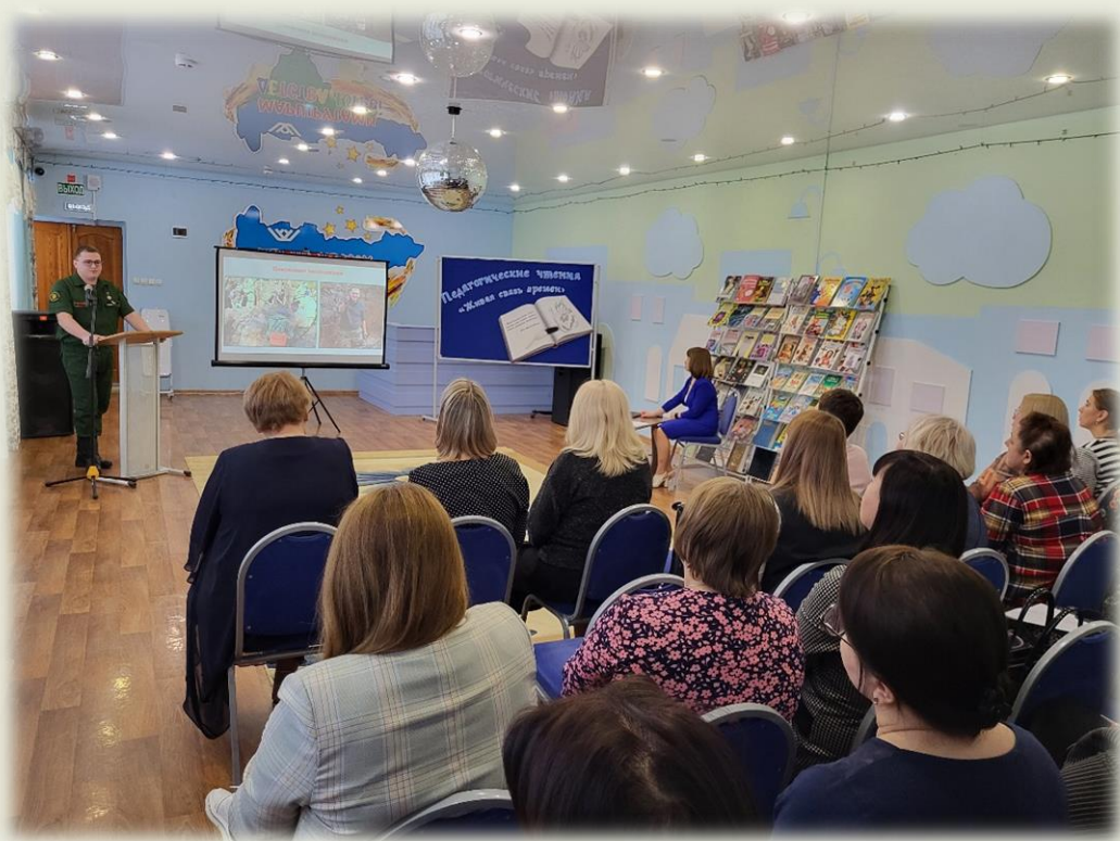
Муниципальные педагогические чтения